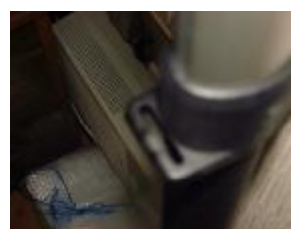
クランク金具の装着穴