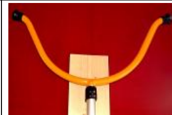
先端ゴムを取り付けた状態 (差し込んであるだけです)