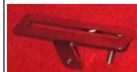
ロゴ取り付け金具 (オプション) 1セット (ネジ含み) 500円