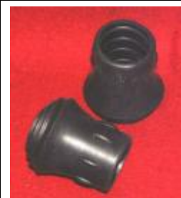
先端危険防止ゴム (オプション) 1セット (2個) 300円