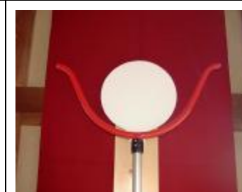
子供達の絵などを書いて張ればよりインテリアとして、意識の向上にも一役かえます。 ロゴ板 (圧紙) (オプション)